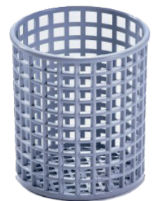
2 x Besteck