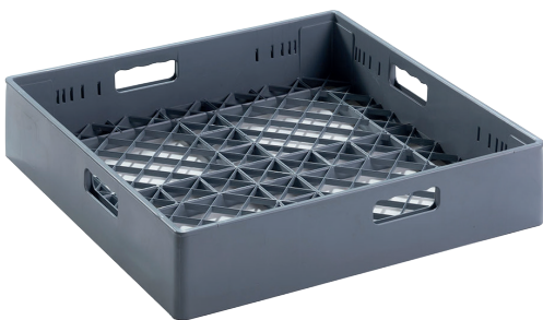
2 x Universal