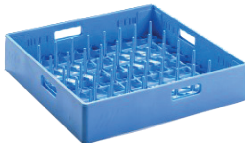
1 x Teller