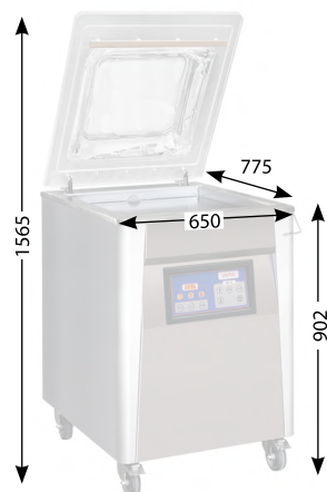
Außenmaße (mm) Outer dimensions (mm) Cotes extérieures (mm)