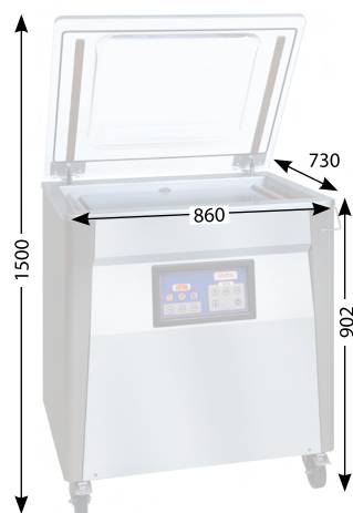
Außenmaße (mm) Outer dimensions (mm) Cotes extérieures (mm)