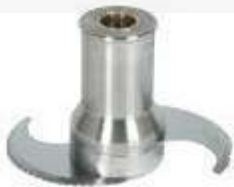
Messer mikroverzahnt Edelstahl