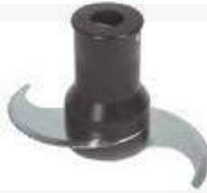
Messer mikroverzahnt Standard