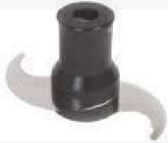
Messer Glatt standard