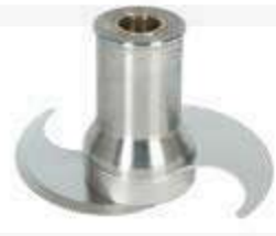
Messer Glatt Edelstahl